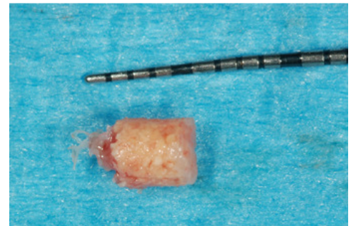
Fig. 6 Carota prelevata da analizzare