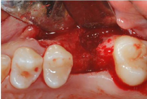
Fig. 1 - Visione intraoperatoria del difetto