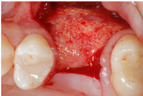
Fig. 4 Alla rimozione della membrana Cytoplast in d-PTFE a 10 mesi si evidenzia la completa risoluzione del difetto