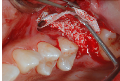
Fig. 2 - Visione vestibolare dell'inserimento di 100% Nanobone particolato