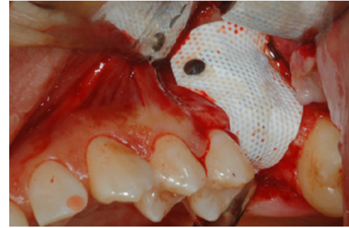
Fig. 3 Stabilizzazione con chiodini di una membrana Cytoplast in d-PTFE rinforzata in titanio