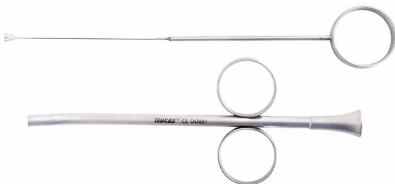
DO050 Bone Carrier Ø int.2,5mm Ø est.3,5 Siringa per Osso