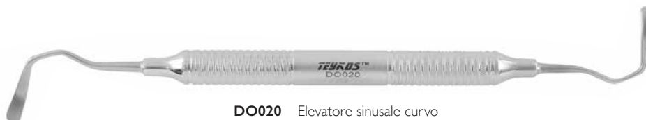
DO020 Elevatore sinusale curvo