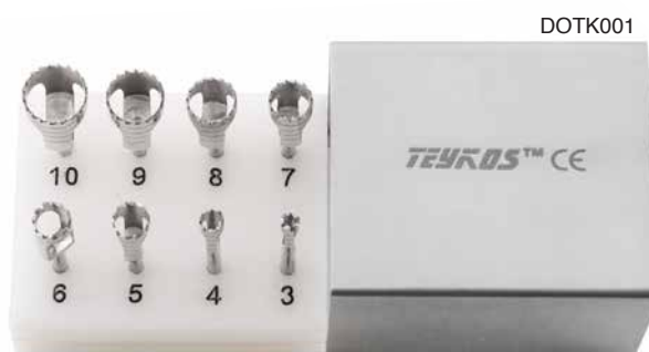
DOTK001 Trephine per osso kit completo 8 unità