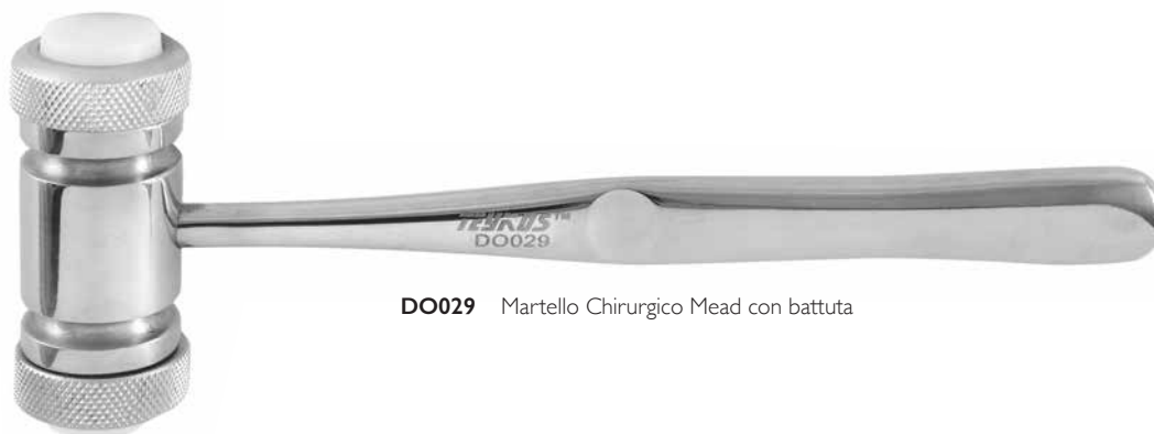
DO029 Martello Chirurgico Mead con battuta