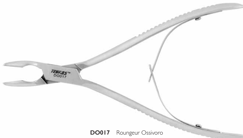
DO017 Rongeur Ossivoro