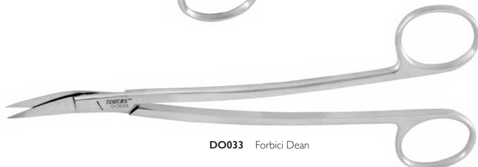
DO033 Forbici Dean