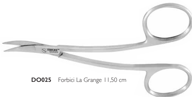
DO025 Forbici La Grange 11,50 cm

DO032 Porta aghi Castroviejo 14 cm per parodontologia