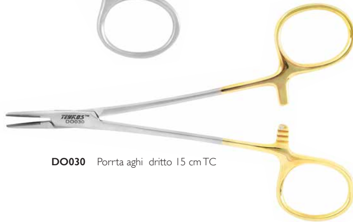
DO030 Porta aghi dritto 15 cm TC