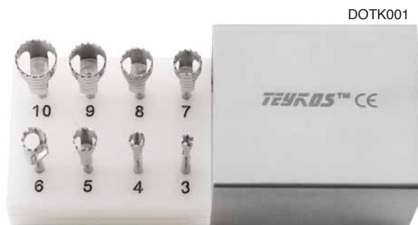
DOTK001 Trephine per osso kit completo 8 unità