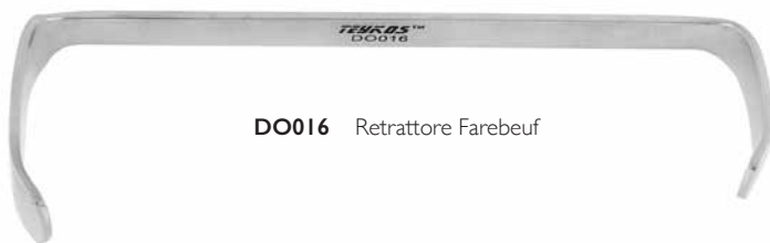
DO016 Retrattore Farebeuf