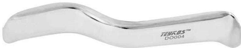
DO004 Retrattore Minnesota