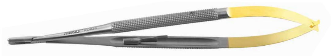
DO038 Porta aghi per implantologia 18 cm