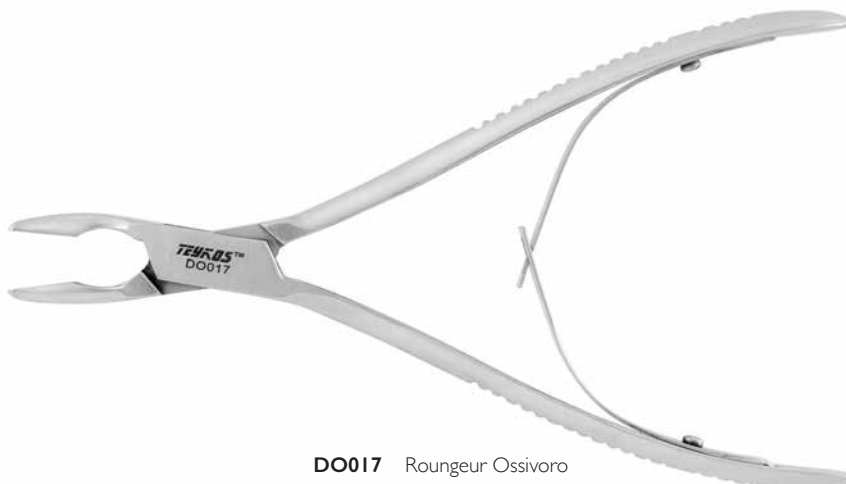
DO017 Rongeur Ossivoro