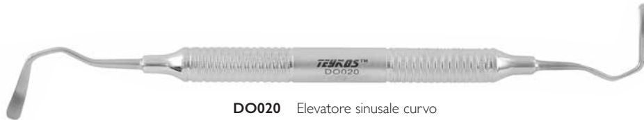
DO020 Elevatore sinusale curvo