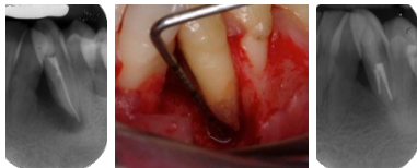
Corso TangramOdis TO-0213d