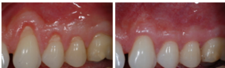
Corso TangramOdis TO-0213a